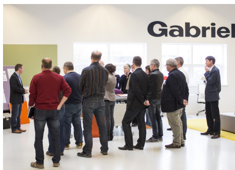
Rundvisning hos Gabriel A/S i forbindelse med et netværksmøde.

Ud over de større netværksmøder afholdes der andre møder ca. en gang om måneden.